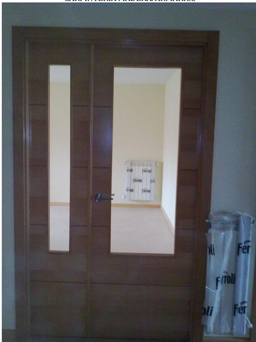
CARPINTERÍA MADERA. PUERTAS SALÓN DOBLE HOJA