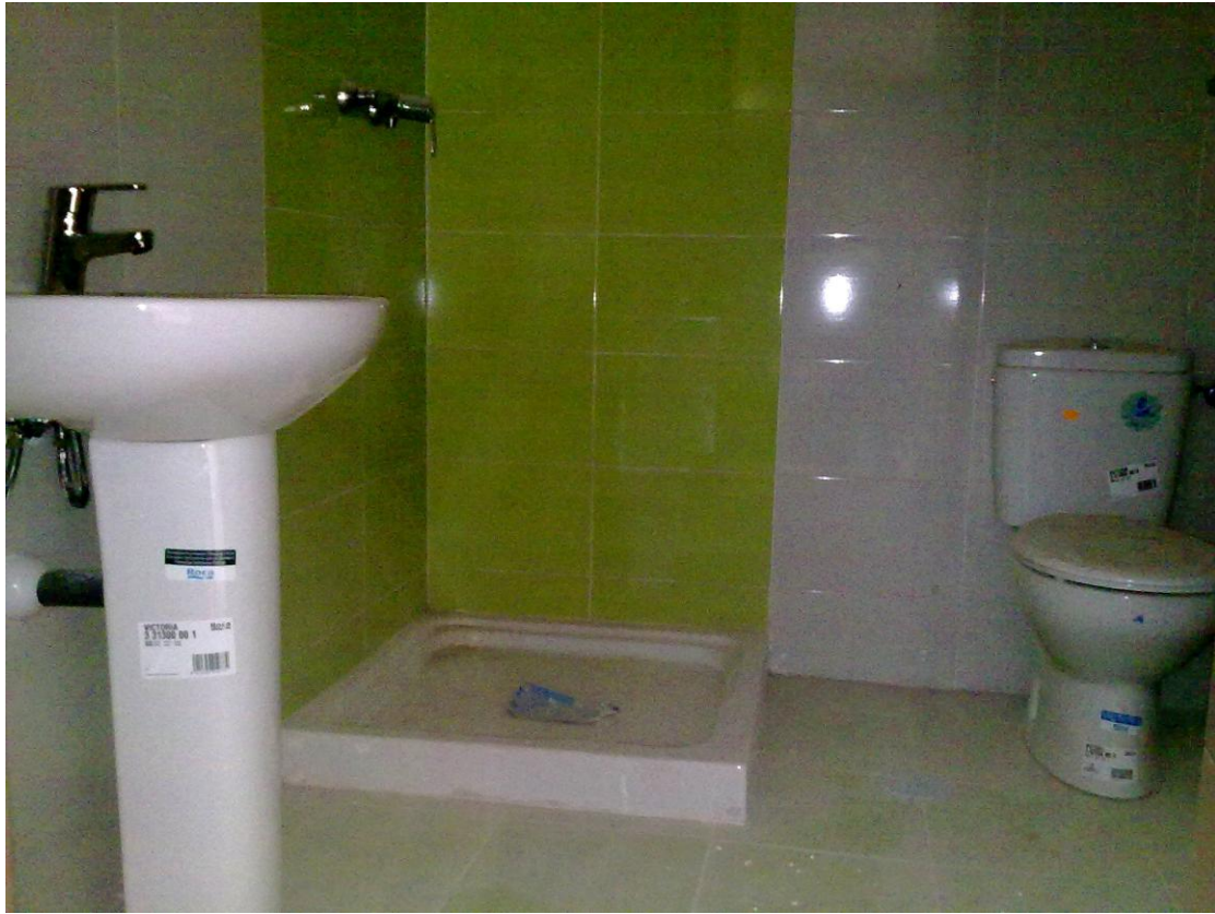
BAÑO SECUNDARIO. APARATOS SANITARIOS.