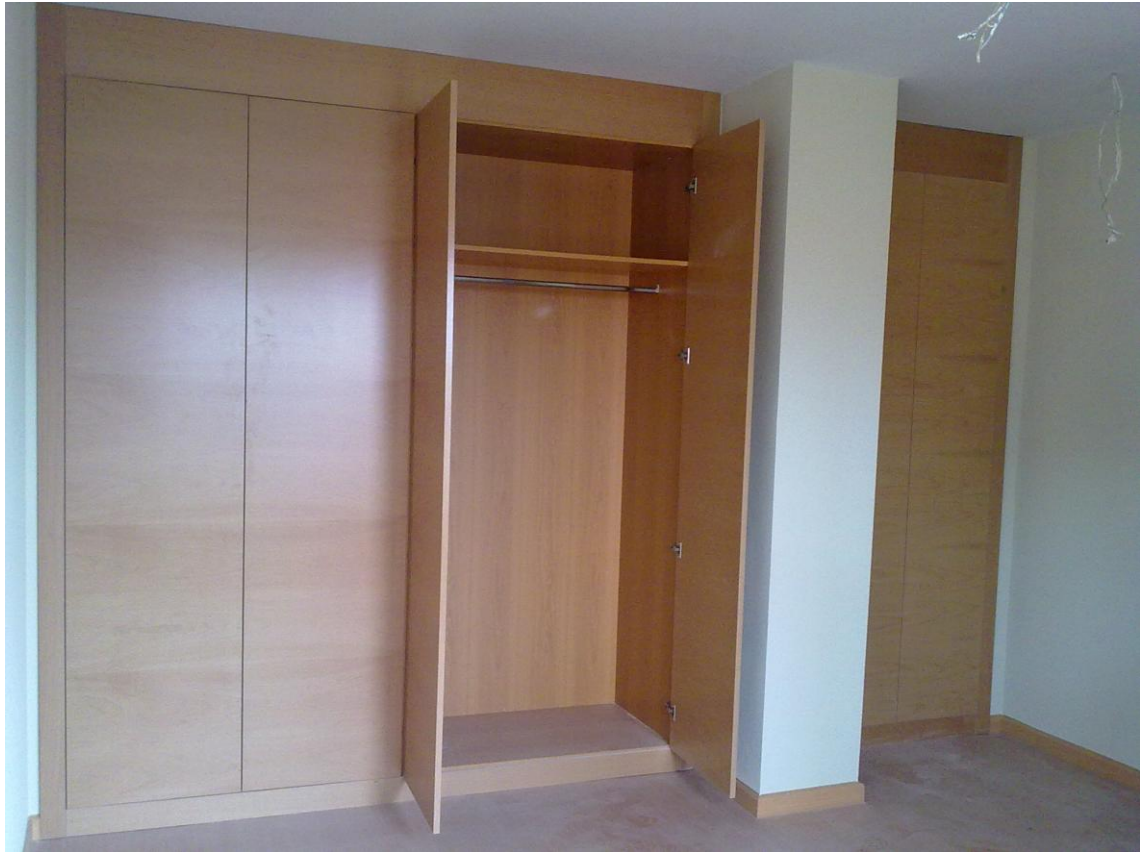
CARPINTERÍA MADERA. ARMARIOS