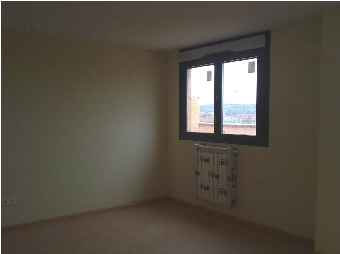
CARPINTERÍA DE ALUMINIO. RADIADORES.