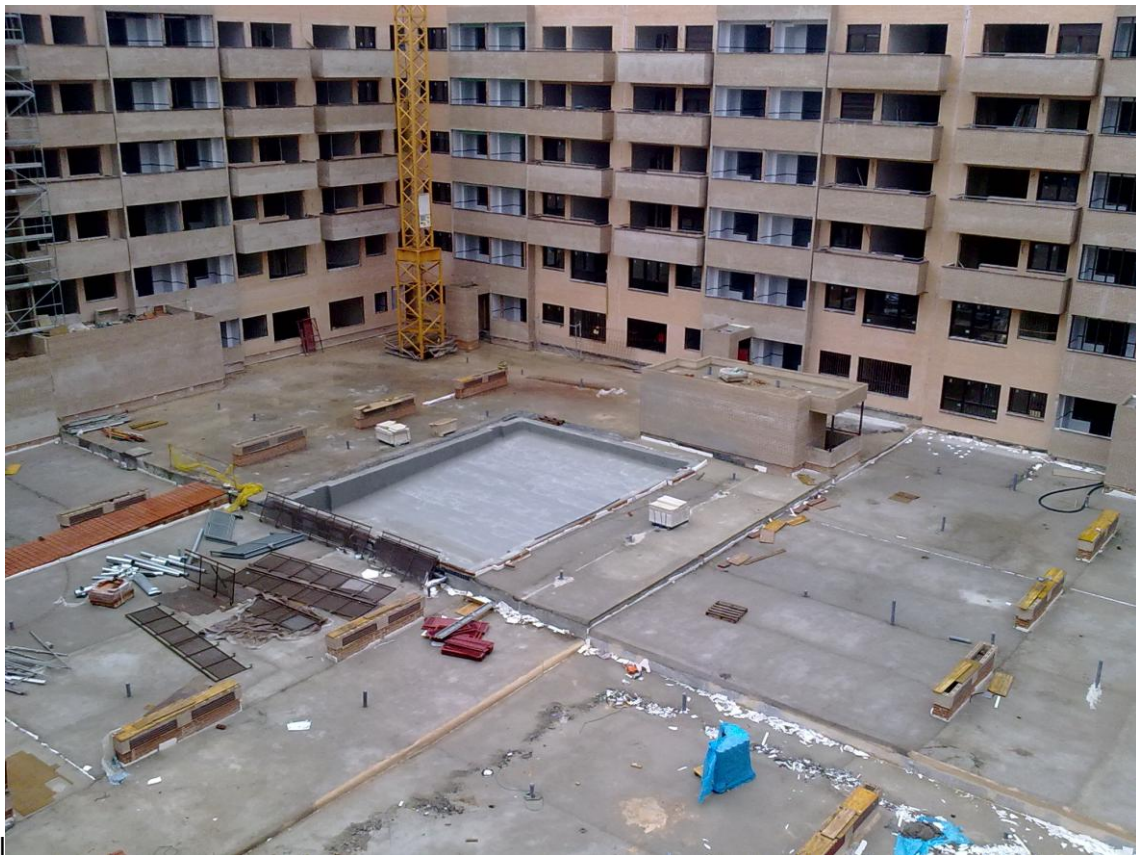
URBANIZACIÓN. CREACIÓN DE PENDIENTES Y PISCINA