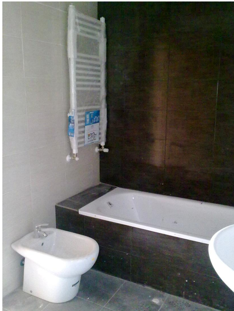
BAÑO PRINCIPAL. APARATOS SANITARIOS Y RADIADOR-TOALLERO