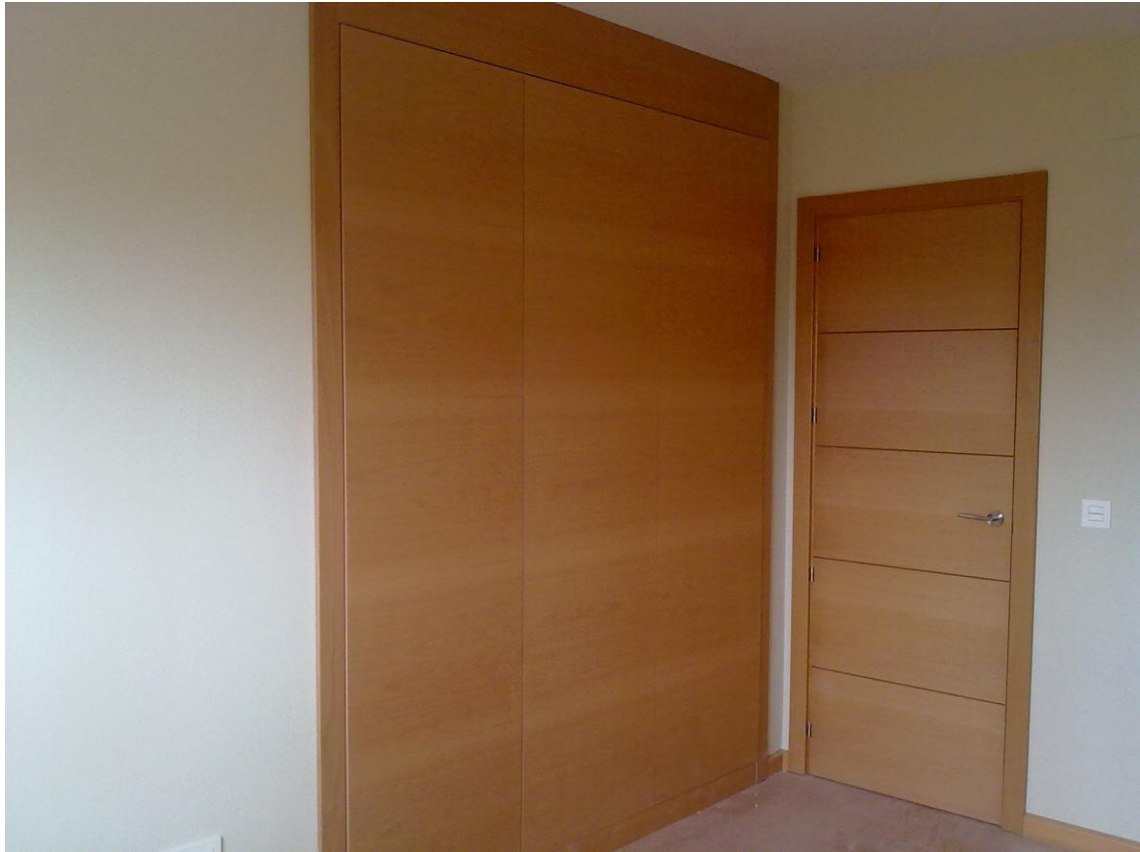
CARPINTERÍA MADERA. ARMARIOS Y PUERTAS HABITACIONES.