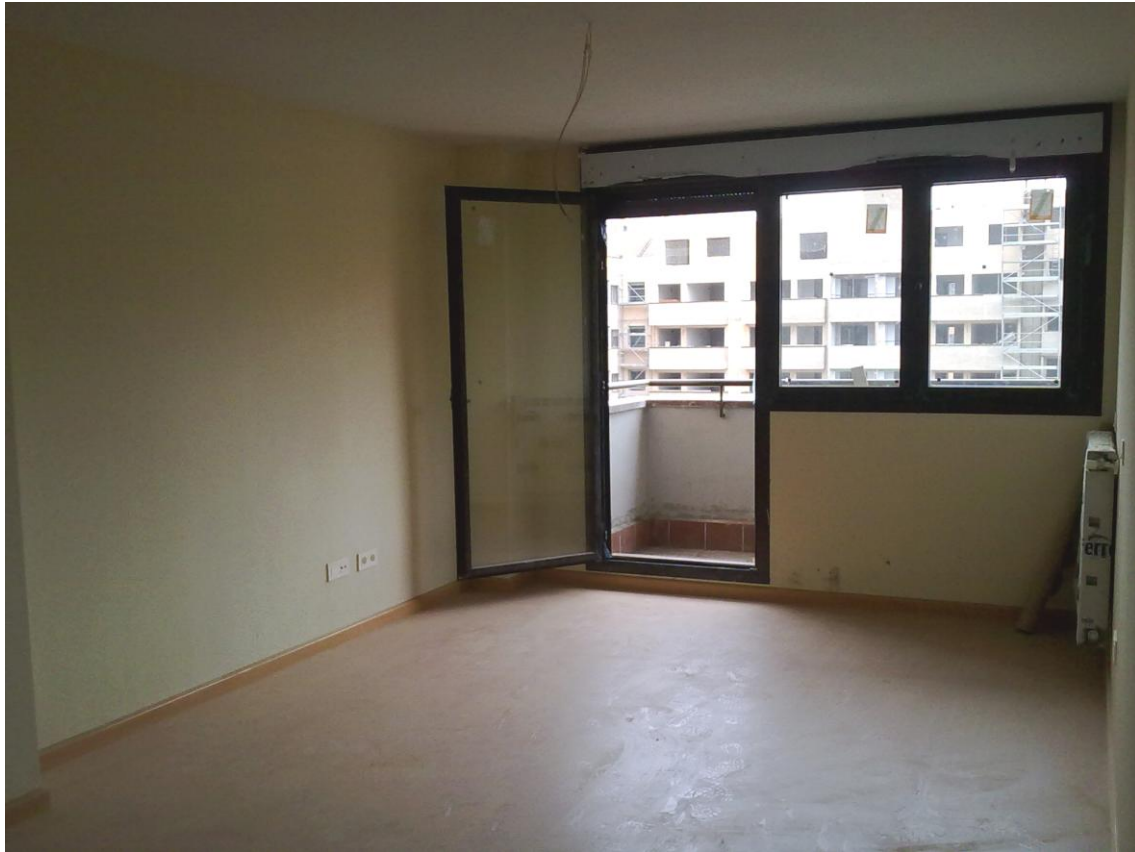
SALÓN. TARIMA, PUERTA TERRAZA.